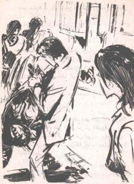
ولكن هذا الأخير استقبل ذراع الرجل بحركة سريعة ماهرة، أمسك بها معصم خصمه ..

ومع سقوط الرجل الأخير، اعتدل (أدهم)، وعذل هندامه، قائلاً :